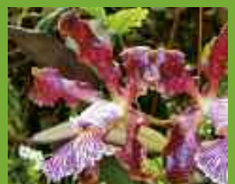
2 x Cattleya schilleriana