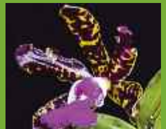
2 x Cattleya Peckaviensis 2 Fotos: Sabine Furtwängler