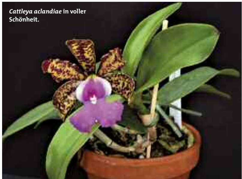
Cattleya aclandiae in voller Schönheit.

Denn die Cattleya schilleriana , Cattleya aclandiae sowie Cattleya Peckaviensis [ aclandiae × schilleriana (1857)] und, nicht zu vergessen, ihre weiteren gezüchteten Hybriden, haben ein reizvolles und anmutiges Erscheinungsbild, das auch in der Orchideenwelt ihresgleichen sucht. Ein Blick zurück in die Geschichte dieser drei Orchideen soll das Bild vervollständigen. >>