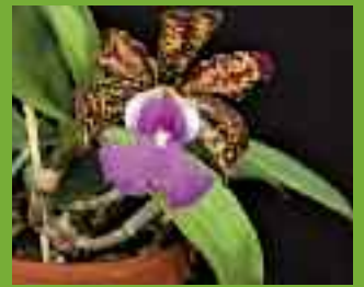
2 x Cattleya aclandiae

In den Provinzen Bahia und Espirant Santo finden sich die natürlichen Vorkommen von Cattleya schilleriana und C. aclandiae .