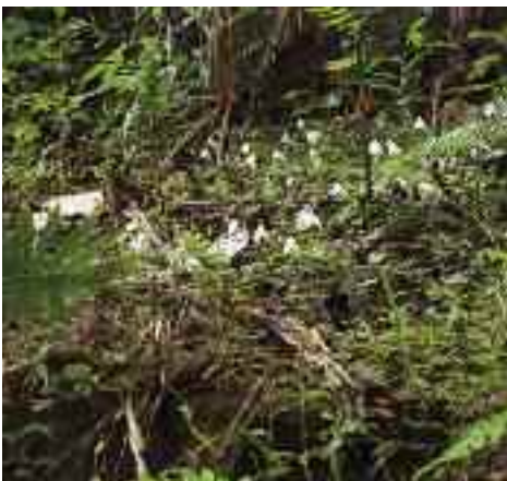
... hier müssen Arundina wachsen.