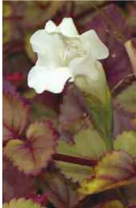
Mehr im Schatten, aber auch mit nassem „Fuß“, diese tolle Gesneriaceae.

Hauptfarben Weiß und Violett – die innere Lippe ist oft gelb. Es werden so Populationen gefunden, die von Reinweiß bis fast komplett Violett ihre Schönheit zeigen. Wenn die Pflanzen fast kein Weiß mehr zeigen, ist die Lippe immer sehr dunkelviolet und der hintere Teil der Blüte wirkt violett überpudert, das Violett ist nur zu erahnen.