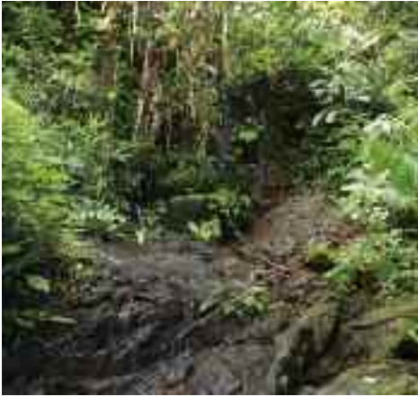
Leicht überspülte Felsen mit ...