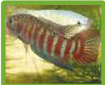
Paradiesfisch aus Vietnam, Macropodus opercularis

Die Pflanzen wachsen im Zentralteil von Vietnam, im Bach-Ma-Gebirge. Damals wanderten wir eine gut ausgebaute Straße, die auf den Gipfel im Bach-Ma-Nationalpark führt und von Touristen normalerweise mit dem Bus genommen wird, hinauf. Das war gut so, denn wir fanden beiderseits der Straße nicht nur herrliche Ausblicke, >>