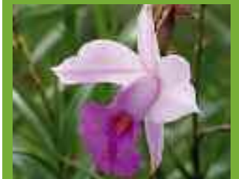
4 x Arundina graminifolia