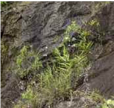
... kargem Boden und viel Licht ...