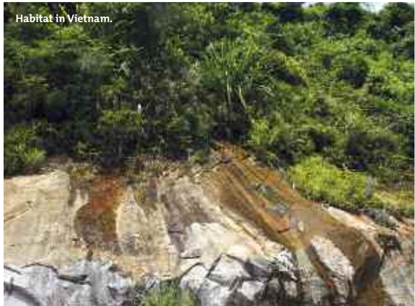
Habitat in Vietnam.

Eine nachfolgend gezeigte Population wurde auf einem spärlich bewachsenen Berg gefunden, an dem im Tagebau vor längerer Zeit Eisen abgebaut wurde. Die groß werdende A. graminifolia , die im tropischen Südostasien vor allem, aber nicht immer, im Bergland gefunden wird, unterscheidet sich vor allem in der Zonierung der beiden