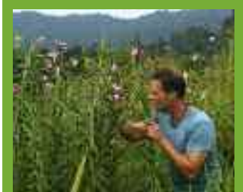
Der Autor mit Arundina .